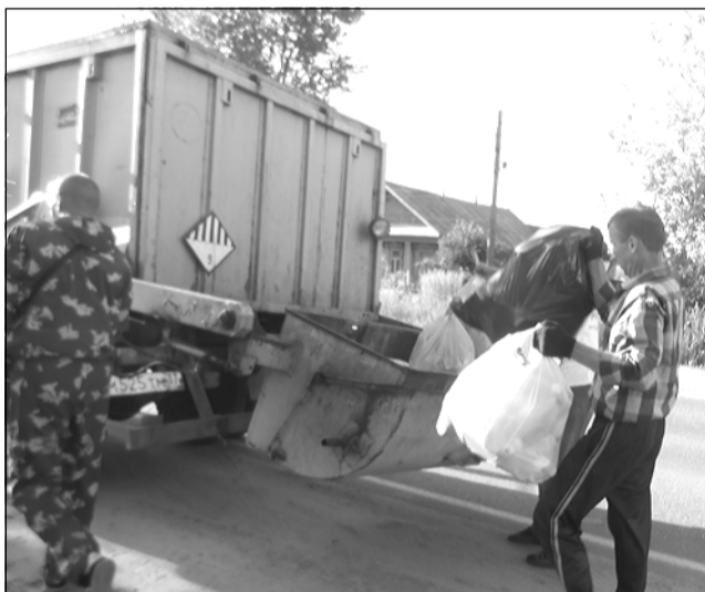
Вывоз мусора при бесконтейнерном способе накопления ТКО.

Но надо понимать, что всегда все нововведения не совершенны и требуют постоянных корректировок с учётом сложившихся обстоятельств, поэтому возникает масса вопросов и непониманий. Многие пестяковцы просят разъяснить ситуацию с контейнерами, порядком и графиком вывоза мусора от частного сектора и другие.