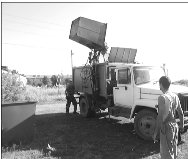
Вывоз мусора при контейнерном способе накопления ТКО.

- Контейнерный способ установлен для жителей многоквартирных домов. Места установки контейнеров определены муниципалитетом с учетом пожеланий жителей. Обязанность нашей компании заключается в том, чтобы своевременно выгружать мусор из контейнера и вывозить его. Весь мусор, высыпавшийся из контейнеров, также убирают сотрудники нашей компании. Так как с контейнерами в Пестяках работаем первую неделю, то совместно с администрацией района первоочередно решаем вопросы периодичности вывоза мусора по мере заполнения контейнеров и увеличения количества контейнеров. Важно на данном этапе определить объемы услуги по сбору и вывозу отходов, которые обеспечат ее своевременность и качество. Конечно, нельзя полагать, что всё и сразу будет идеально, пройдем время, и мы отра-