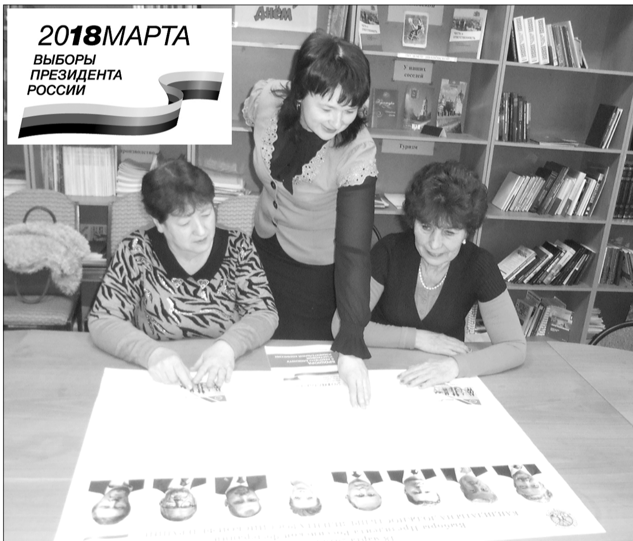
(Интервью читайте на 3 стр.)