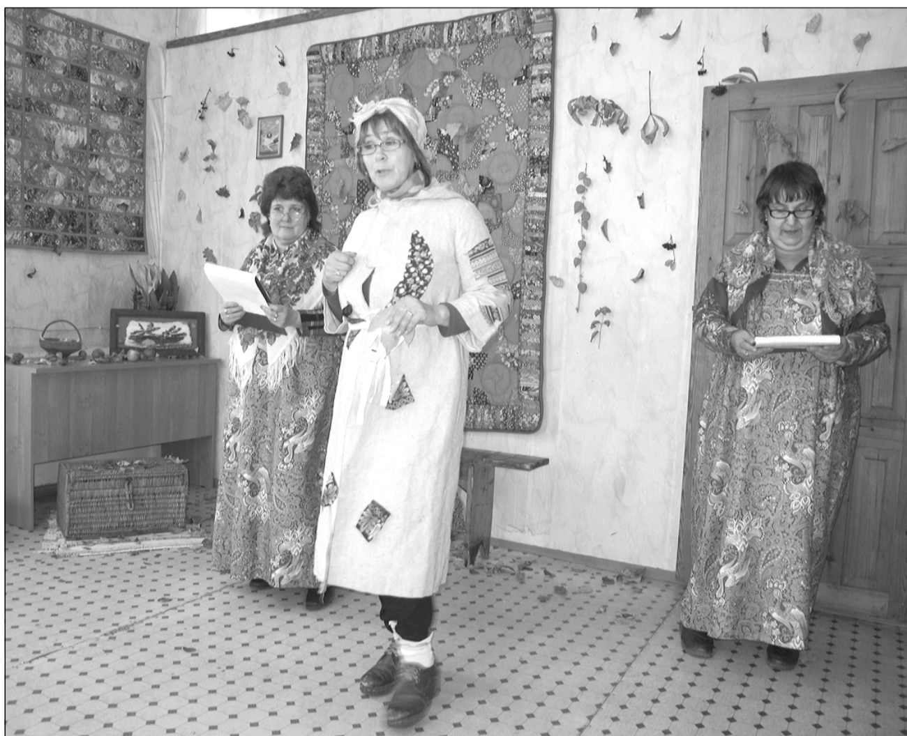
О мероприятиях, прошедших в Пестяковском районе, читайте на 11 странице.

Ежегодно с 1990 года в октябре-ноябре в Ивановской области проходит многожанровый фестиваль искусств “Дни российской культуры”, учреждённый правительством Ивановской области. Это уникальный просветительский проект, направленный на сохранение лучших образцов российской культуры и содействие патриотическому и нравственно-эстетическому воспитанию детей и подростков. В фестивале принимают участие все учреждения культуры региона и муниципальные районы области.