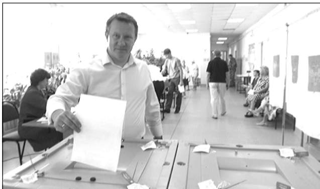
Избирательный участок №572.

9 сентября состоялись выборы Губернатора Ивановской области и депутатов Ивановской областной Думы седьмого созыва. В этот день жители Пестяковского района выбирали будущее региона, в том числе родного района. Всего в муниципалитете в этот день было открыто 9 избирательных участков, которые работали с 8.00 до 20.00 часов. В Едином дне голосования приняли участие 42,79% жителей Пестяковского района от общего количества избирателей, занесённых в списки.