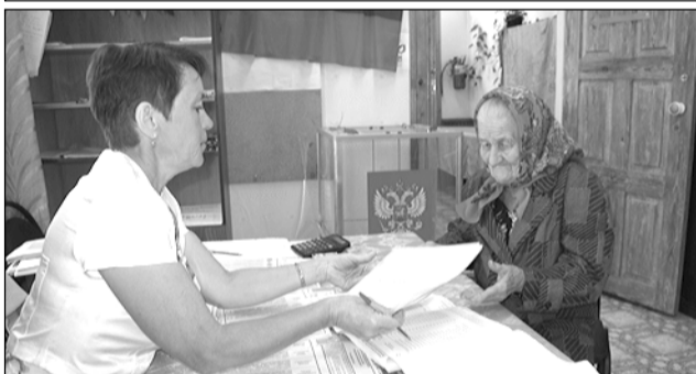
Избирательный участок №564.