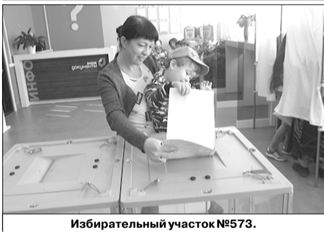
Избирательный участок №573.