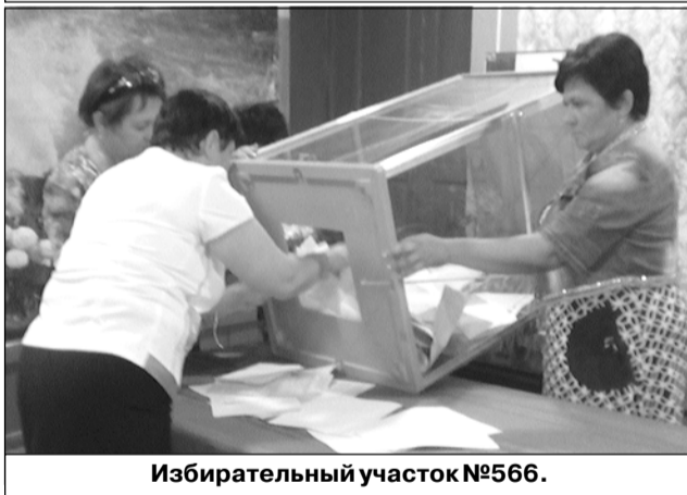
Избирательный участок №566.